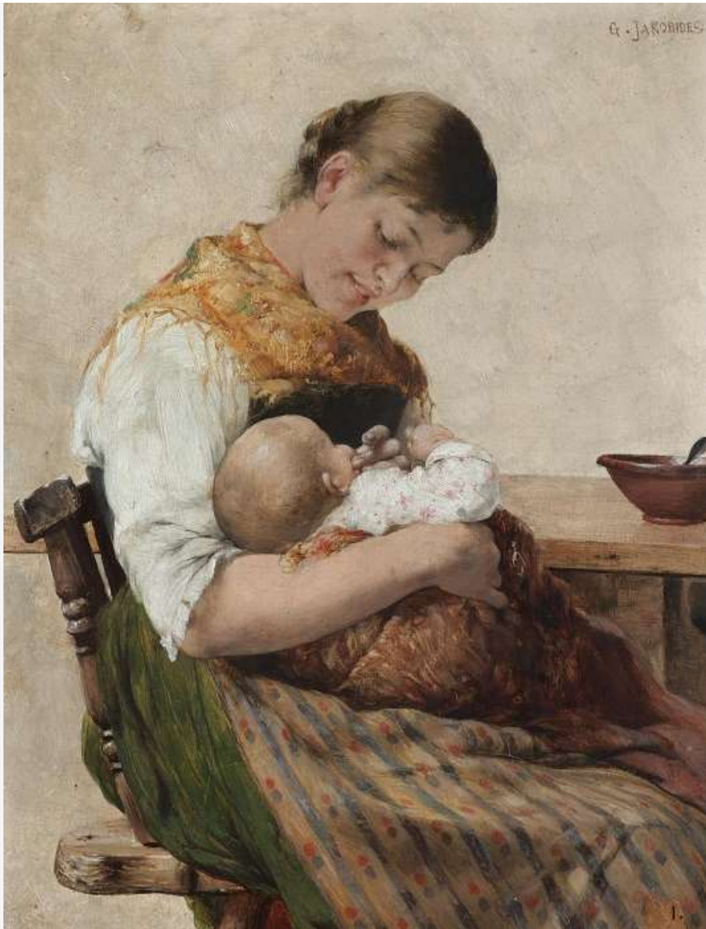
Γεώργιος Ιακωβίδης «Η μητρική στοργή»