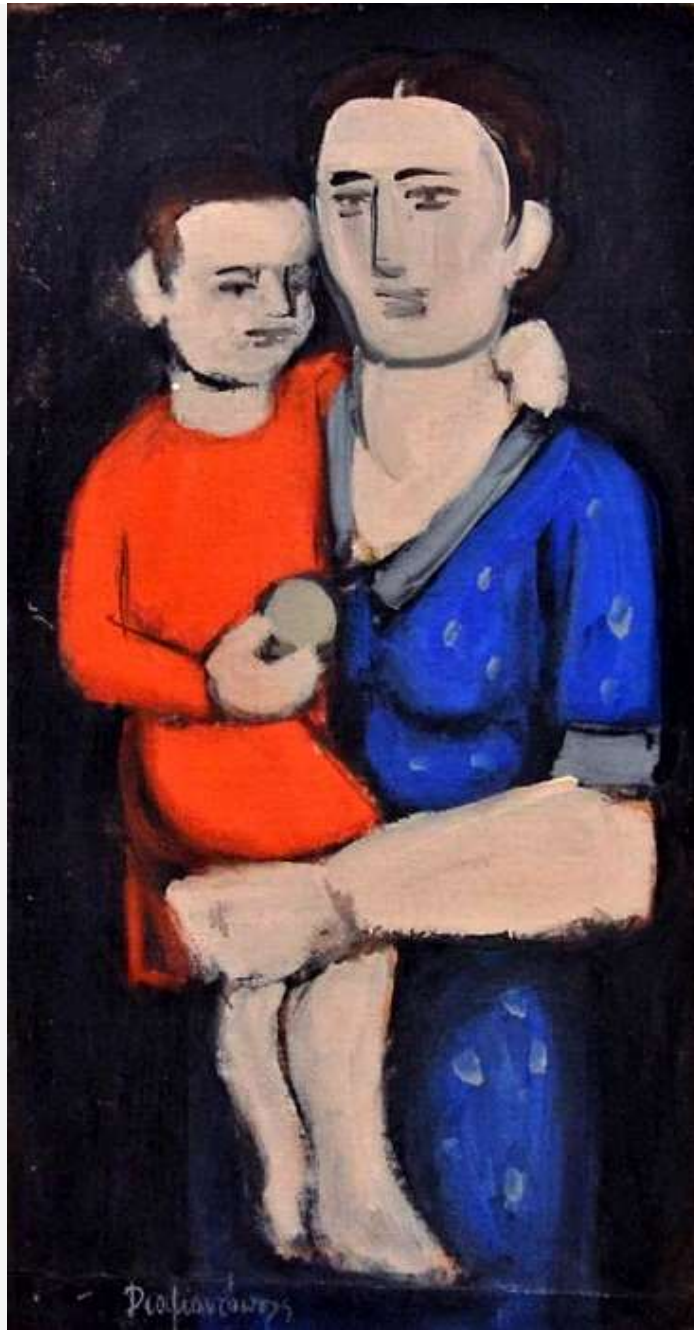
Διαμαντής Διαμαντόπουλος (1914 - 1995), «Μάνα με παιδί»