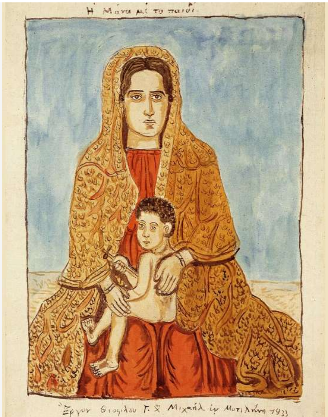
Θεόφιλος, «Η μάνα με το παιδί»