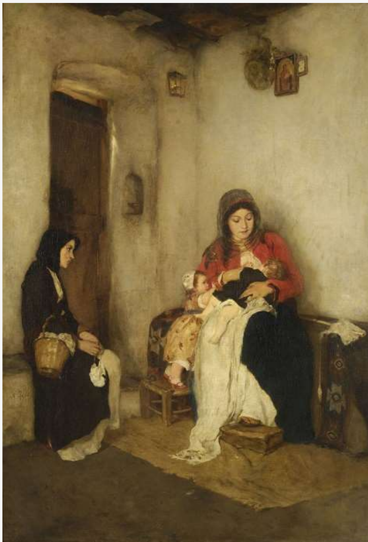
Γύζης Νικόλαος, «Ψυχομάννα - Καλομάννα»

«Η Παραμυθία» θεωρείται συνέχεια του έργου «Ο αποχωρισμός του νέου». Στο βάθος η Ακρόπολη που δεσπόζει στο σκληρό αττικό τοπίο. Δεξιά ο τσομπάνης στηριγμένος στο ραβδί φαίνεται να αγναντεύει προς την Ακρόπολη. Το κοπάδι δεν φαίνεται πουθενά. Μοιάζει κάτι να περιμένει. Ίσως κάποιο ευχάριστο μαντάτο για να το μεταφέρει στη θλιμμένη γυναίκα.