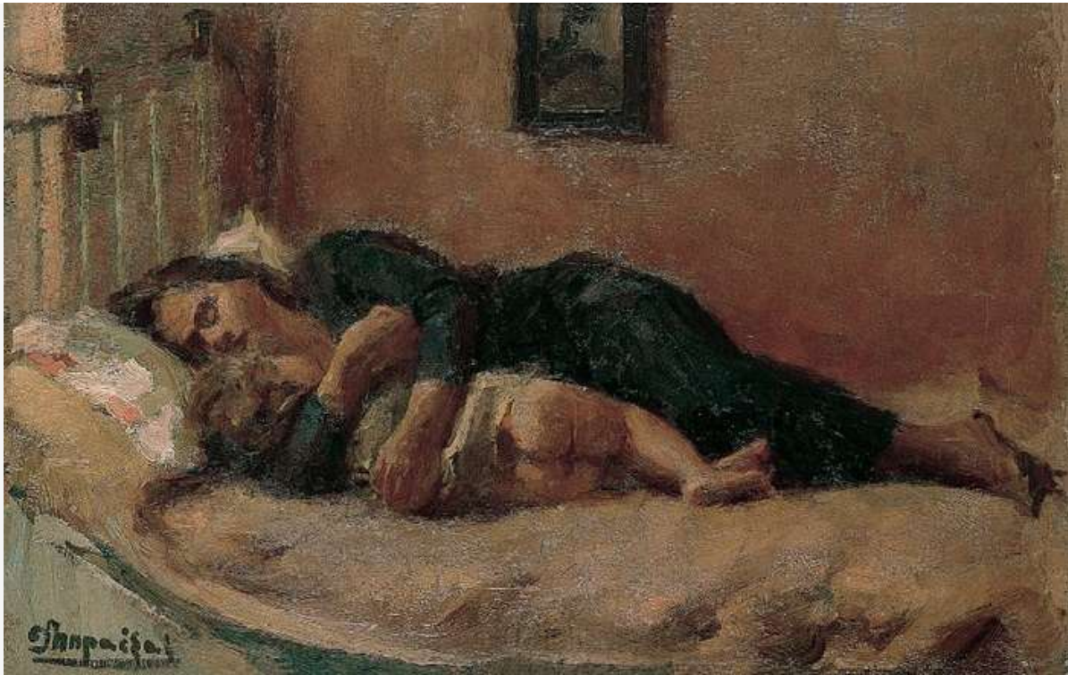
Δήμος Μπραέσας -Στοργή