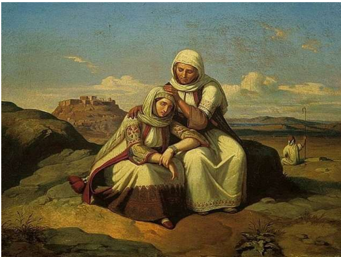
Θεόδωρος Βρυζάκης - «Παραμυθία»

Με αφορμή τη Γιορτή της Μητέρας παρουσιάζουμε δέκα έργα κορυφαίων Ελλήνων ζωγράφων που υμνούν τη μητρότητα. Έργα που καλύπτουν ένα ευρύ φάσμα της σύγχρονης ελληνικής δημιουργίας. Ξεκινώντας από τη μάνα του '21, τη μάνα της ελληνικής ηθογραφίας, της βουκολικής ζωής και φθάνοντας στην αστή μάνα του τέλους 20 ου αιώνα. Παρουσιάζονται έργα των Θεόδωρου Βρυζάκη, Νικολάου Γύζη, Θεόφιλου, Γιώργου Ιακωβίδη, Επαμεινώνδα Θωμόπουλου, Δήμου Μπραέσα, Διαμαντή Διαμαντόπουλου, Δημήτρη Γαλάνη, Βάσως Κατράκη, Γιάννη Μόραλη.