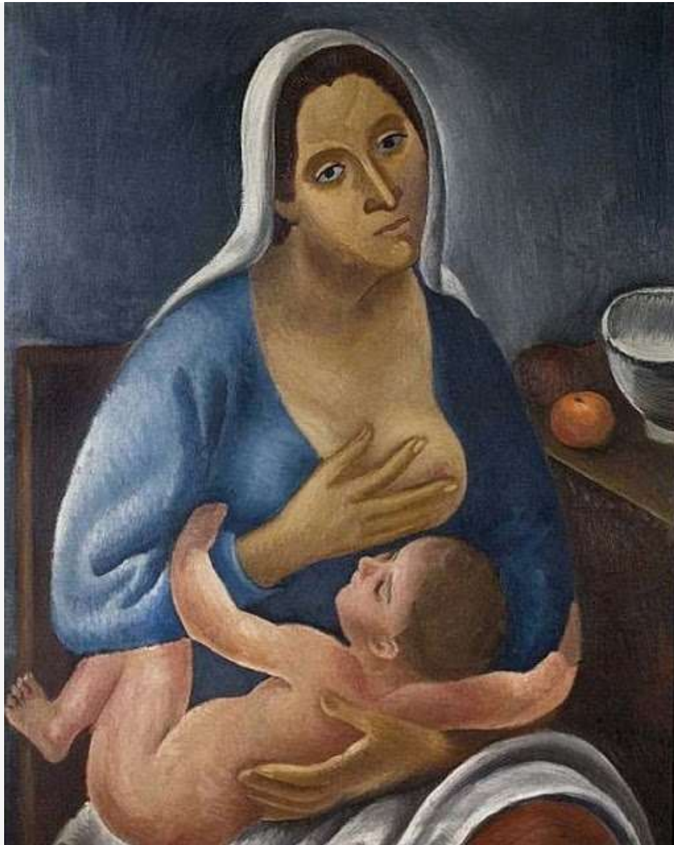
Δημήτρης Γαλάνης «Μητρότητα»